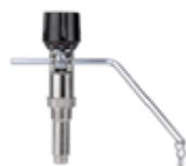
Регулятор тяги в стандартной комплектации

247210 Республика Беларусь Гомельская область г. Жлобин ул. Петровского 44, оф. 309 тел/факс: +375 2334 3 77 77 моб. тел: +375 29 176 22 54 моб. тел: +375 29 135 22 67